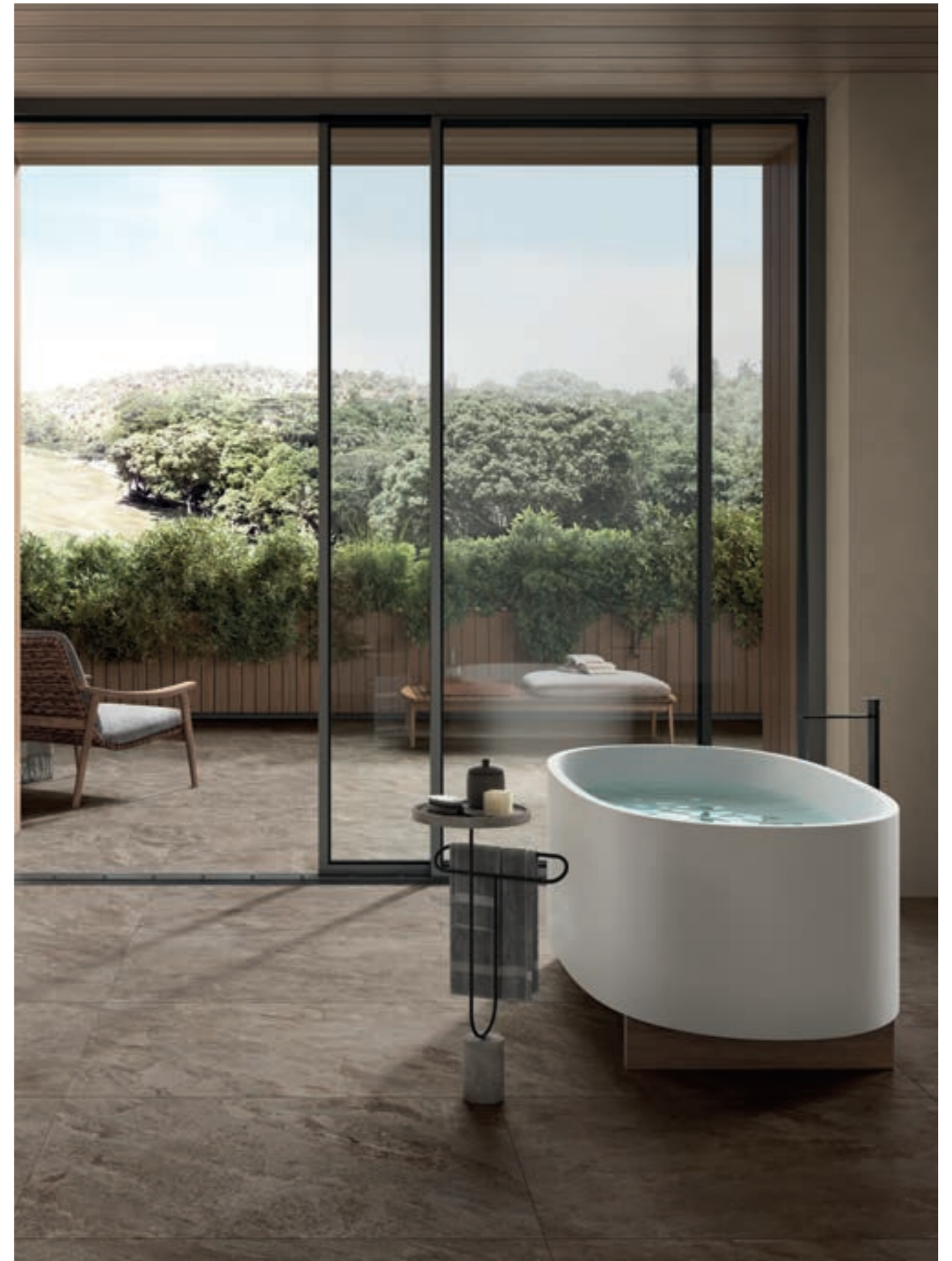
Quarzite Black | 60x119,8 24"x48" Rect